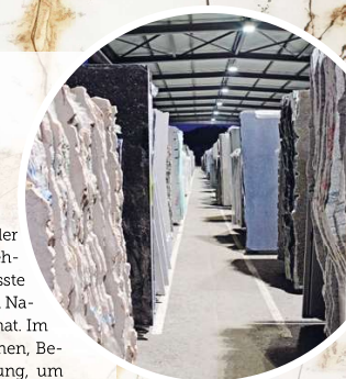
Viel Inspiration und grosse Auswahl gibt es in der neu gestalteten Ausstellung und der Natursteinhalle

Aus einer kleinen Steinsägerei ist im Verlauf der letzten 95 Jahre ein stolzes Schweizer Unternehmen gewachsen, das sich auf die traditionsbewusste und nachhaltige Verarbeitung von hochwertigen Natursteinen aus allen Teilen der Welt spezialisiert hat. Im neuen Showroom gibt es jede Menge Inspirationen, Bemusterungen und eine umfassende Fachberatung, um den persönlichen Favoriten für Küche, Bad und Böden, für Treppen und Aussenflächen aus der grossen Vielfalt auszuwählen. Dazu stehen in der Natursteinhalle mehr als 500 Natursteinplatten zur Auswahl bereit.