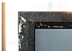
Perfektion in der Verarbeitung: anspruchsvolle Kantendetails mit Abschrägungen