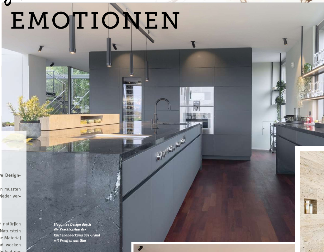
Elegantes Design durch die Kombination der Küchenabdeckung aus Granit mit Fronten aus Glas