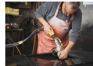
In der Natursteinmanufaktur werden die Steine mit Traditionsbewusstsein und Millimeterpräzision in die gewünschte Form gebracht